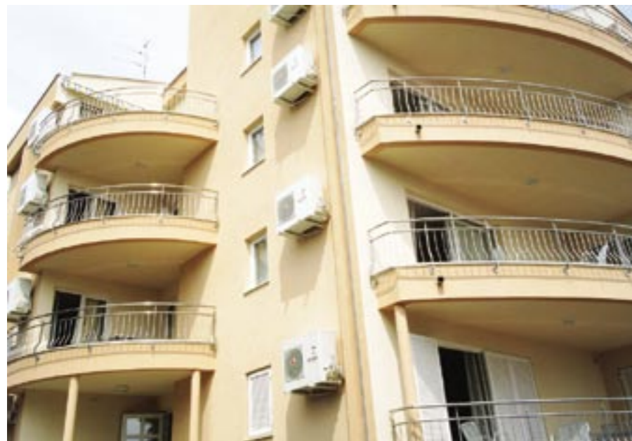
Objekt Selce. Svi stanovi opremljeni su modelom TELECONTROL T10. Izvođač: Mramoterm d.o.o.

Posebna zanimljivost u ponudi su modeli koji koriste GSM modul, pa je od sada moguće daljinski kontrolirati grijanje i u objektima koji nemaju provedenu telefonsku liniju. U TELECONTROL s GSM