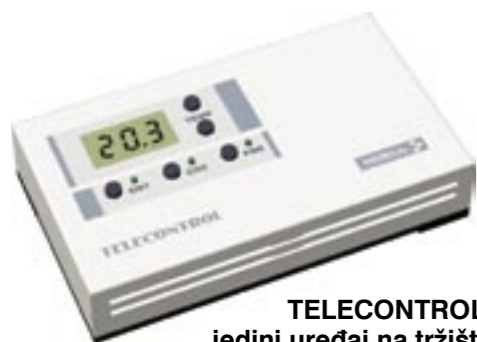
TELECONTROL je jedini uređaj na tržištu s mogućnošću daljinskog podešavanja temperature

Za cijenu boljeg sobnog termostata dobijamo ovo moderno kućno "čudo" koje će svakako impresionirati znance i prijatelje.