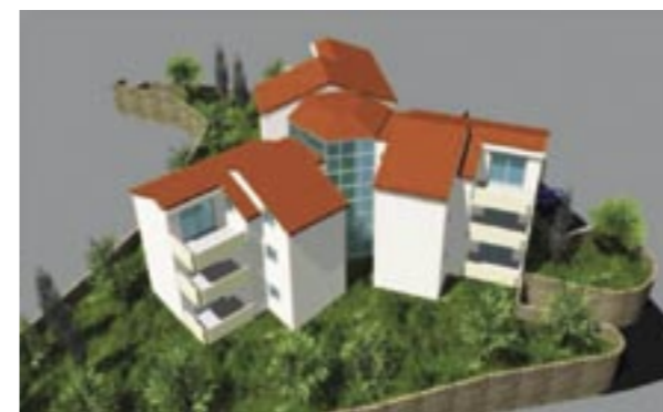
Objekt Malinska. Svi stanovi opremljeni su GSM modelom TELECONTROL T10-GSM. Investitor: Montis d.o.o. Izvođač: Penel d.o.o.

TELECONTROL uređaji primjenjivi su na gotovo sve vrste grijanja. Tako je njima moguće kontrolirati plinska, uljna i električna centralna grijanja, solarna grijanja, električna podna grijanja, električne radijatore i konvektore, mramorne grijače ploče, termoakumulacijske peći, bojlere te klima uređaje (za grijanje ili hlađenje). TELECONTROL je vrlo dobro osmišljen, jednostavan za rukovanje i nudi sve što bi se od