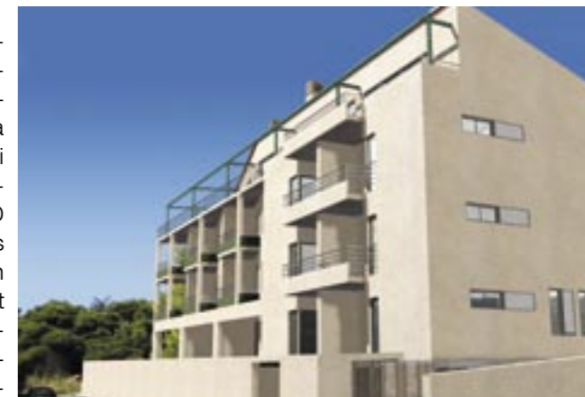
Objekt Gortanova uvala, Pula Svi stanovi opremljeni su programabilnim modelima T10-DP Investitor: Fundamentum d.o.o., Pula Izvođač stroj. instalacija: PSV-engineering d.o.o., Pula

Posebnost TELECONTROL uređaja je govorna komunikacija na hrvatskom jeziku. Korisnik pu-