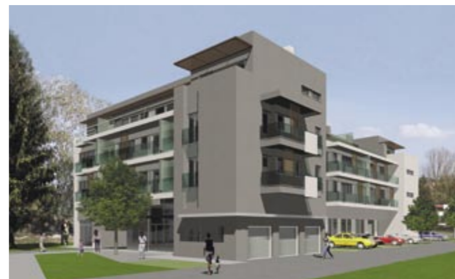
Objekt Vrapče, Zgb, svi stanovi opremljeni su novim modelima TELECONTROL T10-D. Investitor: Amcro tehnika d.o.o. Projektant: Studio Arhing d.o.o.

TELECONTROL uređaji mogu se spojiti na običnu telefonsku liniju ili na ISDN liniju s analognim ulazom. Neovlašten pristup TELECONTROL-u onemogućen je primjenom promjenjive korisničke šifre.